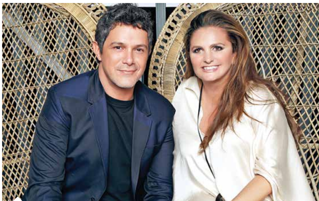
Con Alejandro Sanz.

“Mi padre es empresario, pero nada que ver con este medio, al principio le parecía que estaba jugando a las muñecas, me decía que me regresara a Tenerife con mi madre :”