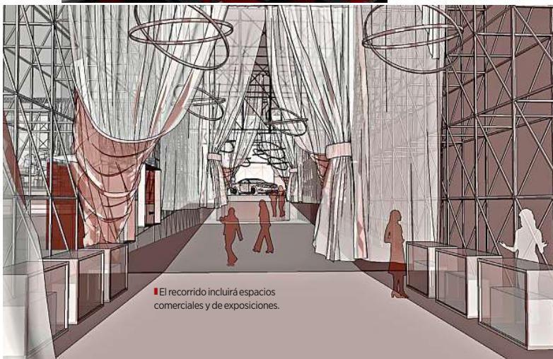
El recorrido incluirá espacios comerciales y de exposiciones.

"La gran bóveda central del espectáculo será una lámpara de notables proporciones; luego, se juega con mucha luz indirecta en suelos, un gran número de lámparas decorativas y una iluminación muy teatral", adelantó el creativo.